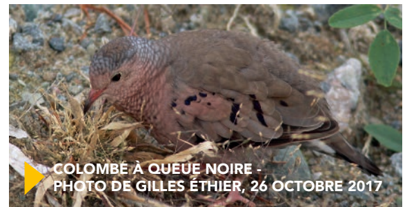
▶ COLOMBÉ À QUEUE NOIRE - PHOTO DE GILLES ÉTHIER, 26 OCTOBRE 2017

Les utilisateurs du secteur ont pu remarquer l'amélioration notable de la qualité de la rivière Bourlamaque et le retour de certaines espèces de poissons, comme le brochet. Les oiseaux sont aussi particulièrement présents. Des espèces rares, telles que le cygne trompette et le grèbe esclavon, ont déjà été observées par les ornithologues et répertoriées sur le site eBird (ebird.org) ; pas moins de 208 espèces sont recensées sur ce site. Mentionnons aussi la présence de la colombe à queue noire, une espèce rare qui attire des gens de partout dans le monde.