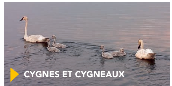
▶ CYGNES ET CYGNEAUX